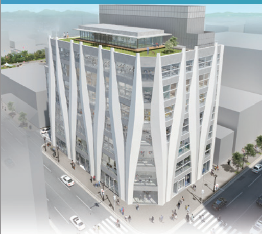
IKEUCHI GATEビル(2022年秋 竣工予定)